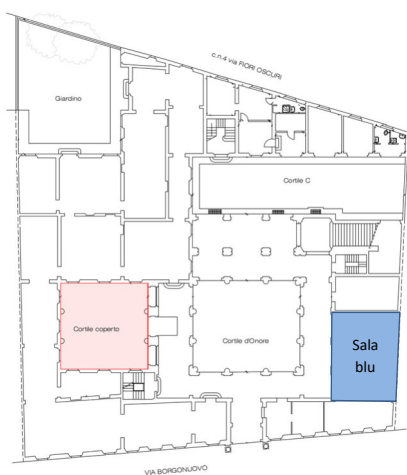
Piano terra – Sala espositiva vetrata – Sala blu