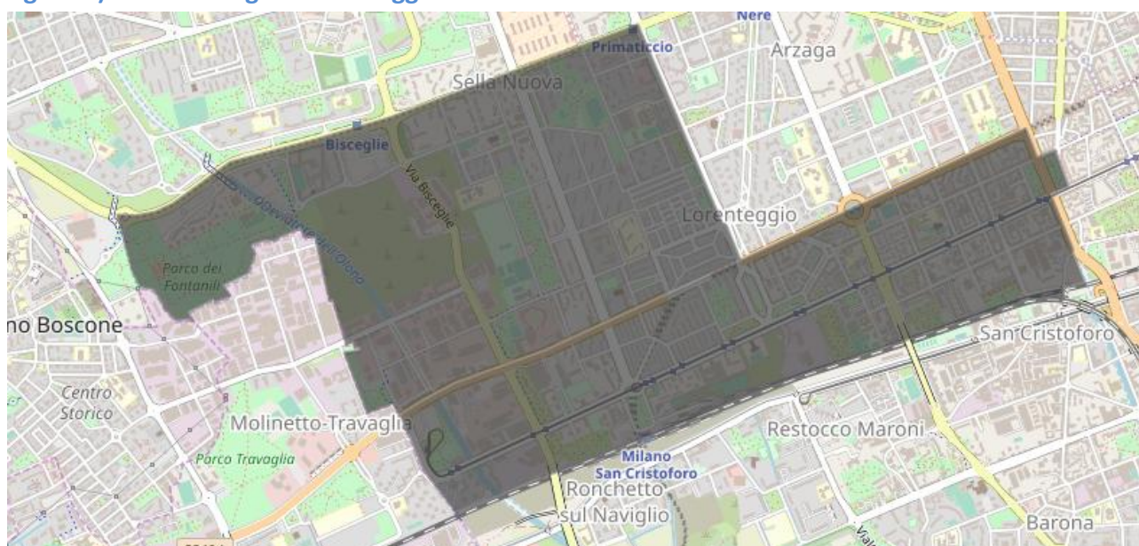
Figura 2) Zona-Bersaglio Lorenteggio Giambellino NIL n. 53 + NIL n. 49